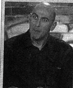
Il comico Sergio Sgrilli

ca nella zona ne sono cadute quattro in tre ore e mezza. Il pericolo resta di grado «5», il più alto, in tutto il settore Nord-occi- dentale della Valle d'Aosta, lun- go l'arco alpino che da Rhêmes attraversa il Monte Bianco e raggiunge il Cervino. Indice «4», forte, nel resto della regione. Restano chiuse anche la strada regionale di Valsavarenche, la statale 27 del Gran San Bernar- do nel tratto dal viadotto dei Dardanelli fino al borgo di Saint- Rhémy (il tunnel è raggiungibi- le) e la comunale della Val Veny a Courmayeur. Sono state riaper- te la statale 26 da Pré-Saint-Di- er a La Thuile e le comunali di Niel a Gaby e di Efrac - Saint- Barthélemy a Quart. Per oggi sono previsti cielo sereno e possi- bile aumento della nuvolosità in serata, venti moderati con raffor- zamenti in quota e temperature in calo.