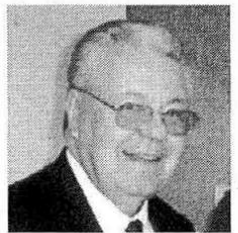
Robert Aymar, direttore Cern

AOSTA - Ieri, venerdì 3 marzo, il Salone delle manifestazioni di Palazzo regionale ha ospitato la conferenza del direttore del Cem di Ginevra, Robert Aymar. Durante la serata lo scienziato ha illustrato i progetti "International Thermonuclear Experimental Reactor"-ITER e "Large Hadron Collider"-LHC. Questi studi hanno per oggetto la dimostrazione della possibilità di poter utilizzare a scopi pacifici l'energia ricavata da processi di fusione nucleare. Il progetto coinvolge oltre 140 istituti di ricerca appartenenti a 34 nazioni e impegnerà oltre 3500 scienziati fra fisici e ingegneri; mai un numero così elevato di ricercatori si è trovato a collaborare sullo stesso obiettivo, mettendo in comune le proprie risorse ed esperienze. Alla serata sono intervenuti il presidente del Consiglio regionale, Ego Perron, il presidente della Regione, Luciano Caveri, e il fisico di fama internazionale e direttore dell'Osservatorio astronomico della Valle d'Aosta, Enzo Bertolini.