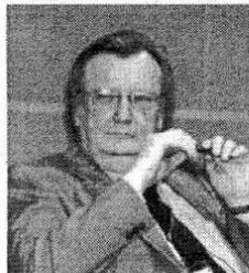
Carlo Rubbia, Premio Nobel

LA THUILE - Da lunedì 6 a sabato 11, a partire dalle 8.30, al Centro congressi dell'Hotel Planibel di La Thuile, si terrà la ventesima edizione dei "Rencontres de Physique de la Vallée d'Aoste", con più di 120 scienziati provenienti da tutto il mondo riuniti a fare il punto sullo stato della ricerca nel campo delle particelle elementari. Sono in programma in particolare le relazioni di quattro Premi Nobel: l'italiano Carlo Rubbia e gli americani Shelly Glashow, Samuel Ting e Jim Cronin. Nel pomeriggio del 6, alle 18.30, si terrà la cerimonia ufficiale con le autorità regionali. Sull'evento sarà realizzato un documentario dallo staff Desandrè Video Pro, coordinato da Romuald Desandrè e da Melinda Siciliano. Si no-