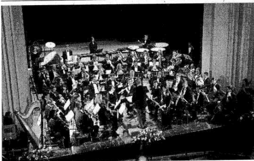
L'Orchestre d'Harmonie du Val d'Aoste nella passata edizione del Concert du Nouvel An